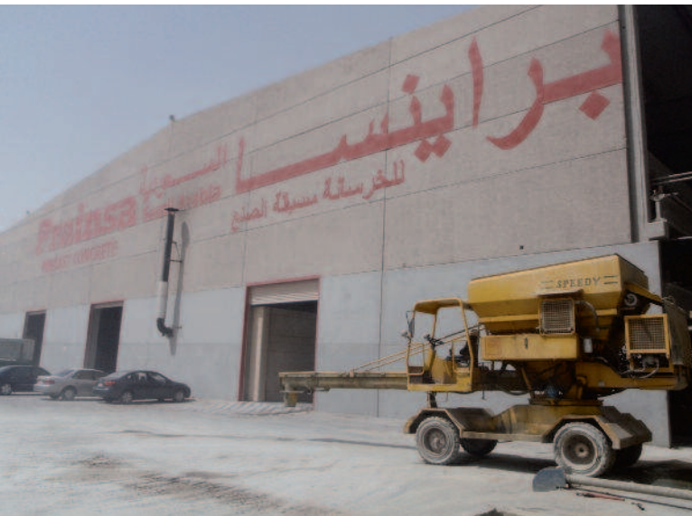
A Speedy da Bianchi Casseforme

A Prainsa Precast Concrete é um grande fabricante de alveolares e elementos de concreto pré-moldado com foco especial em arranha-céus, prédios comerciais, centros de distribuição, shopping centers e construção de pontes. Hoje, ela é sinônimo de um grande arranjo de serviços de qualidade que abrange planejamento técnico, engenharia civil, fabricação de elementos de concreto pré-moldado junto com seu transporte, assim como montagem de telhado e acabamentos finais ao prédio. A Prainsa também fabrica dormentes de ferrovia como parte de sua contribuição à infra-estrutura ferroviária.