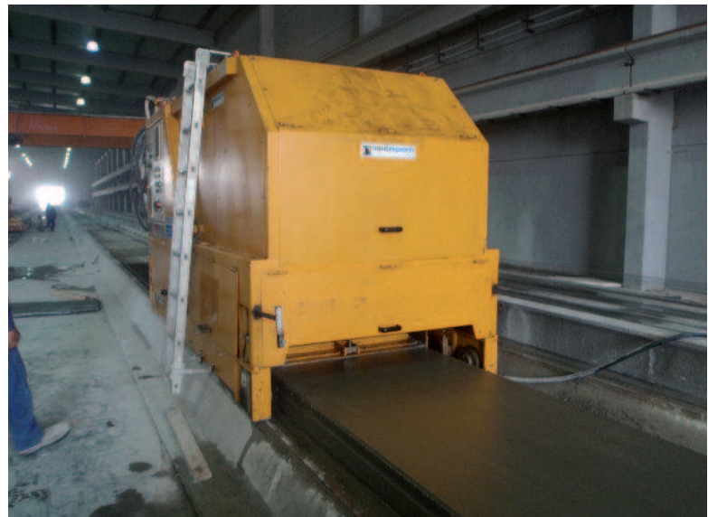
A extrusora System da Nordimpianti em ação

Fundada em 1973 em Zaragoza, Espanha, a Prainsa tem aproveitado firmemente as últimas tecnologias para oferecer a seus clientes serviços customizados e/ou completar soluções enquanto cresce como líder na indústria da construção muito além das fronteiras europeias. De fato, o Prainsa Group hoje possui 20 fábricas espalhadas pela Espanha, França, Chile, Argentina, Peru e recentemente inaugurou uma em Damman, Arábia Saudita.